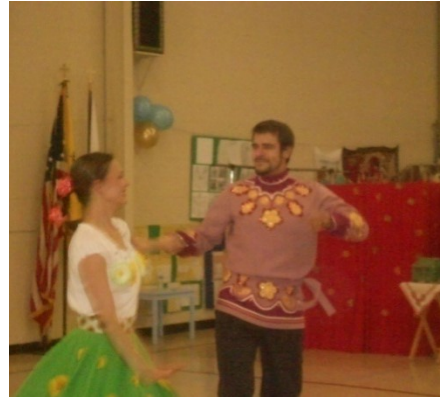
Танцевальный ансамбль «Золотые купола России»